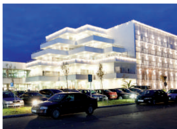
LIEČEBNÝ DOM VEĽKÁ FATRA****