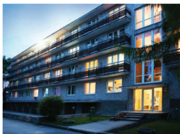
LIEČEBNÝ DOM AQUA**