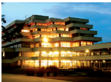
LIEČEBNÝ DOM VEĽKÁ FATRA***