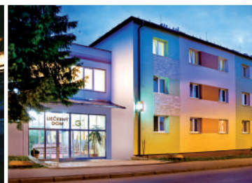
LIEČEBNÝ DOM MALÁ FATRA