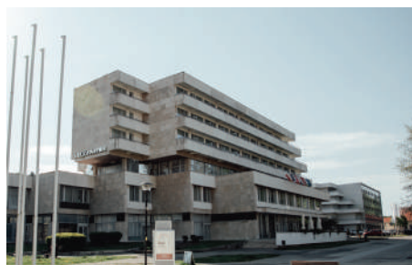
LIEČEBNÝ DOM VEĽKÁ FATRA***