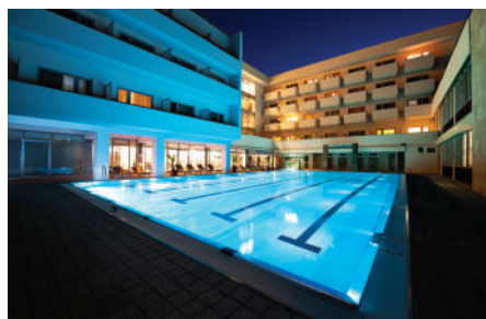
LIEČEBNÝ DOM VEĽKÁ FATRA****