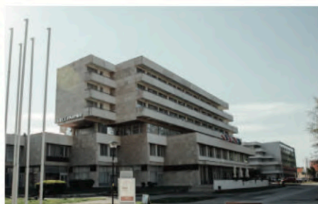
LIEČEBNÝ DOM VEĽKÁ FATRA***